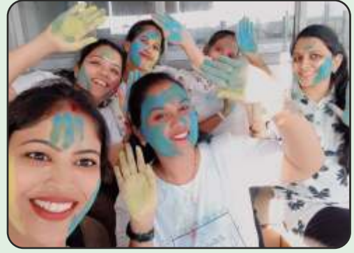
Holi Celebration at Mora, Surat