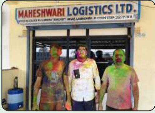
Holi Celebration at Gandhidham office