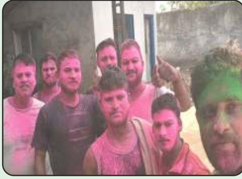
Holi Celebration at MLL House, Vapi